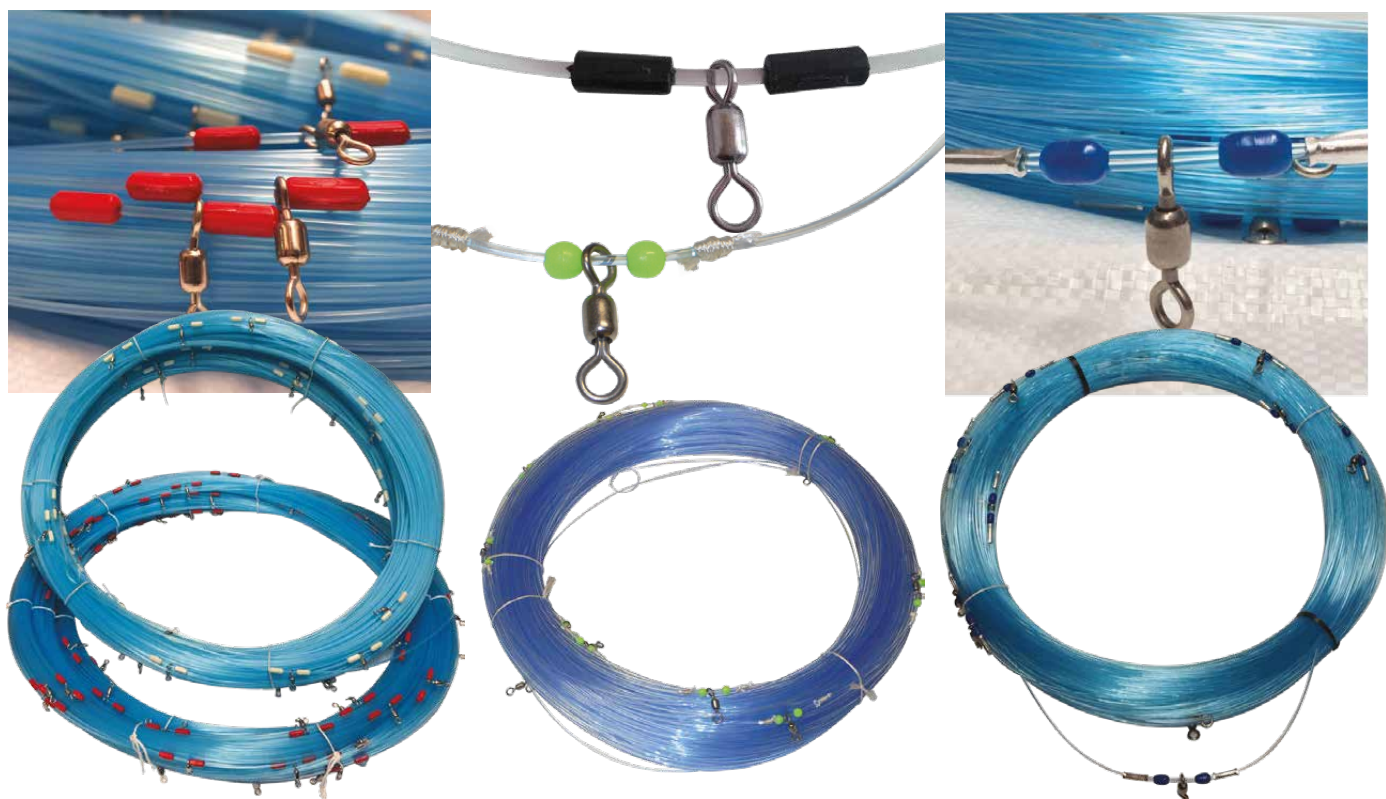
Matassa Armata con Stopper