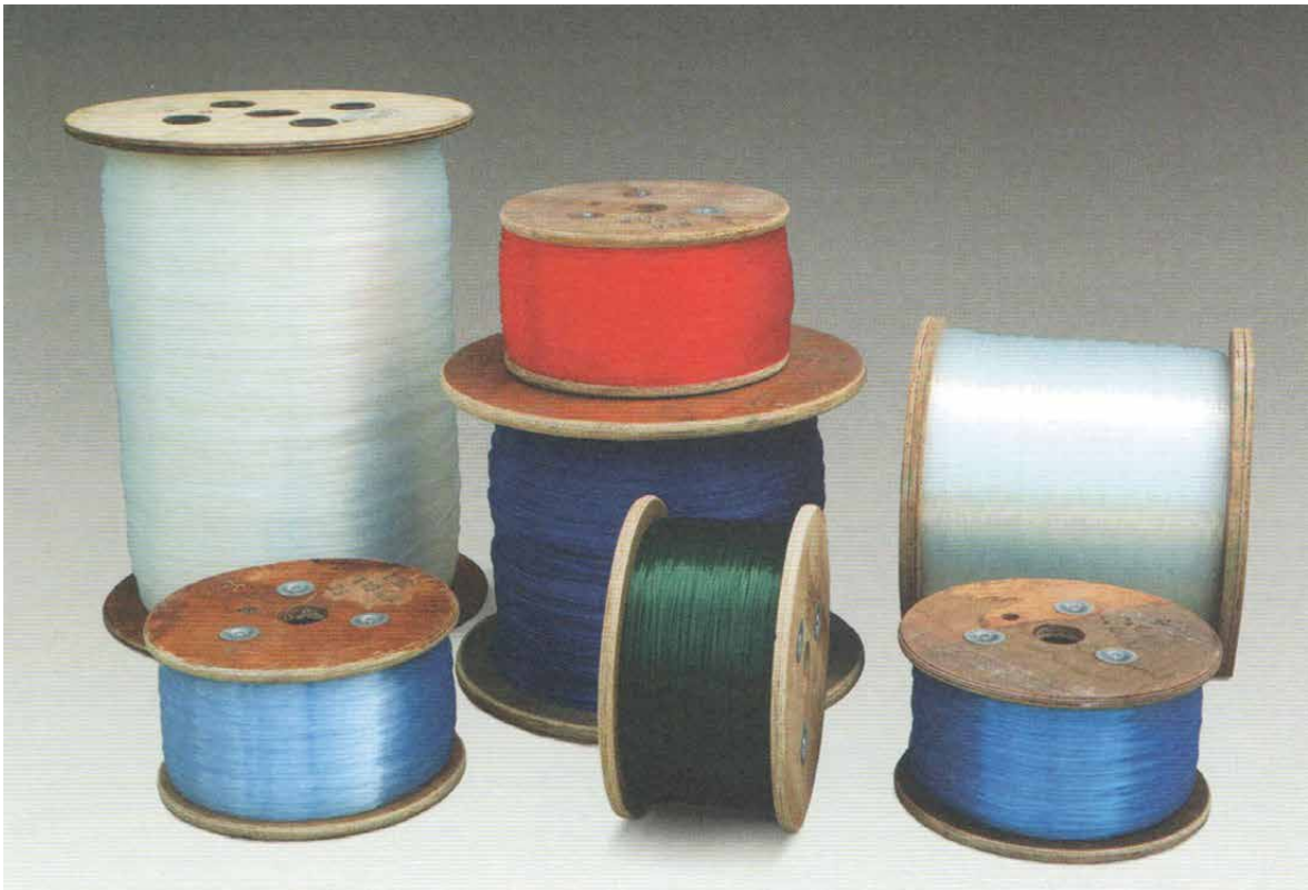
Bobine pesca sportiva

Monofilo utilizzato per la pesca professionale da pescarecci di grandi dimensioni che hanno installato a bordo un sistema di recupero del palangaro a rullo. Questo sistema viene utilizzato nella pesca oceanica, dove le correnti sono molto forti ed è impossibile lavorare con il sistema tradizionale. Su richiesta è possibile inserire degli stopper a montaggio desiderato che serve al bloccaggio dei moschettoni.